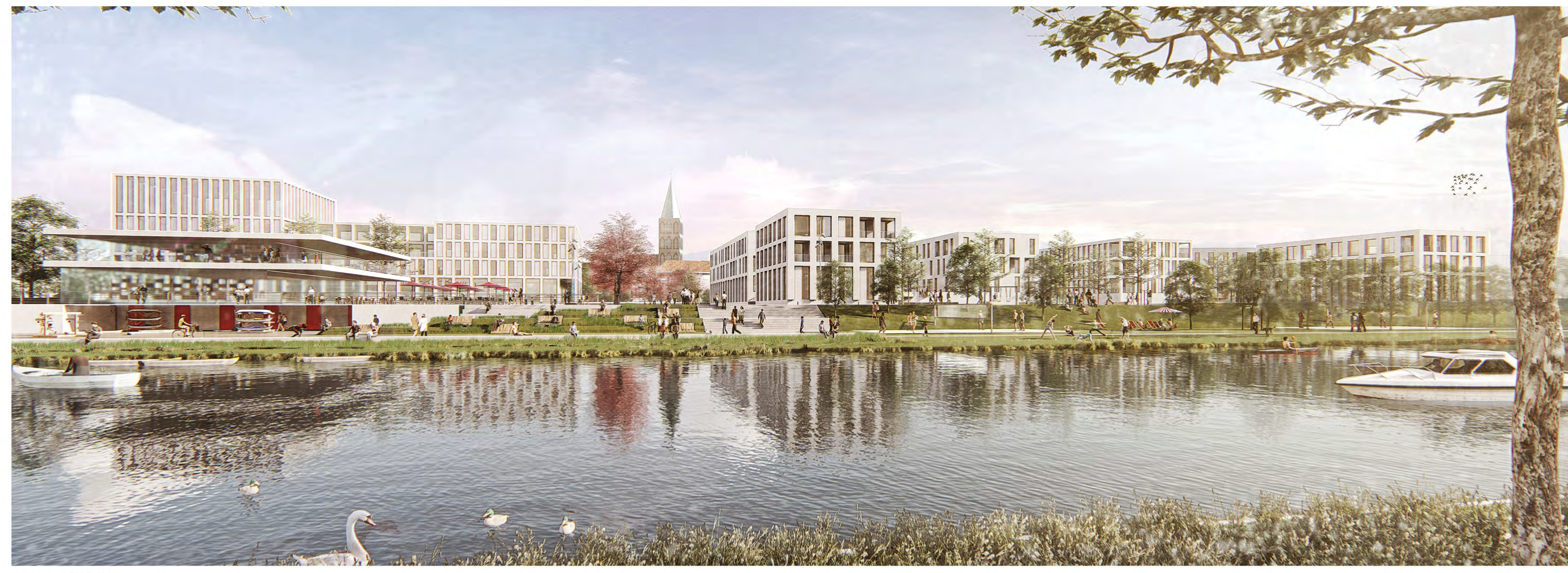
PERSPEKTIVE | DAS NEUE KANALQUARTIER