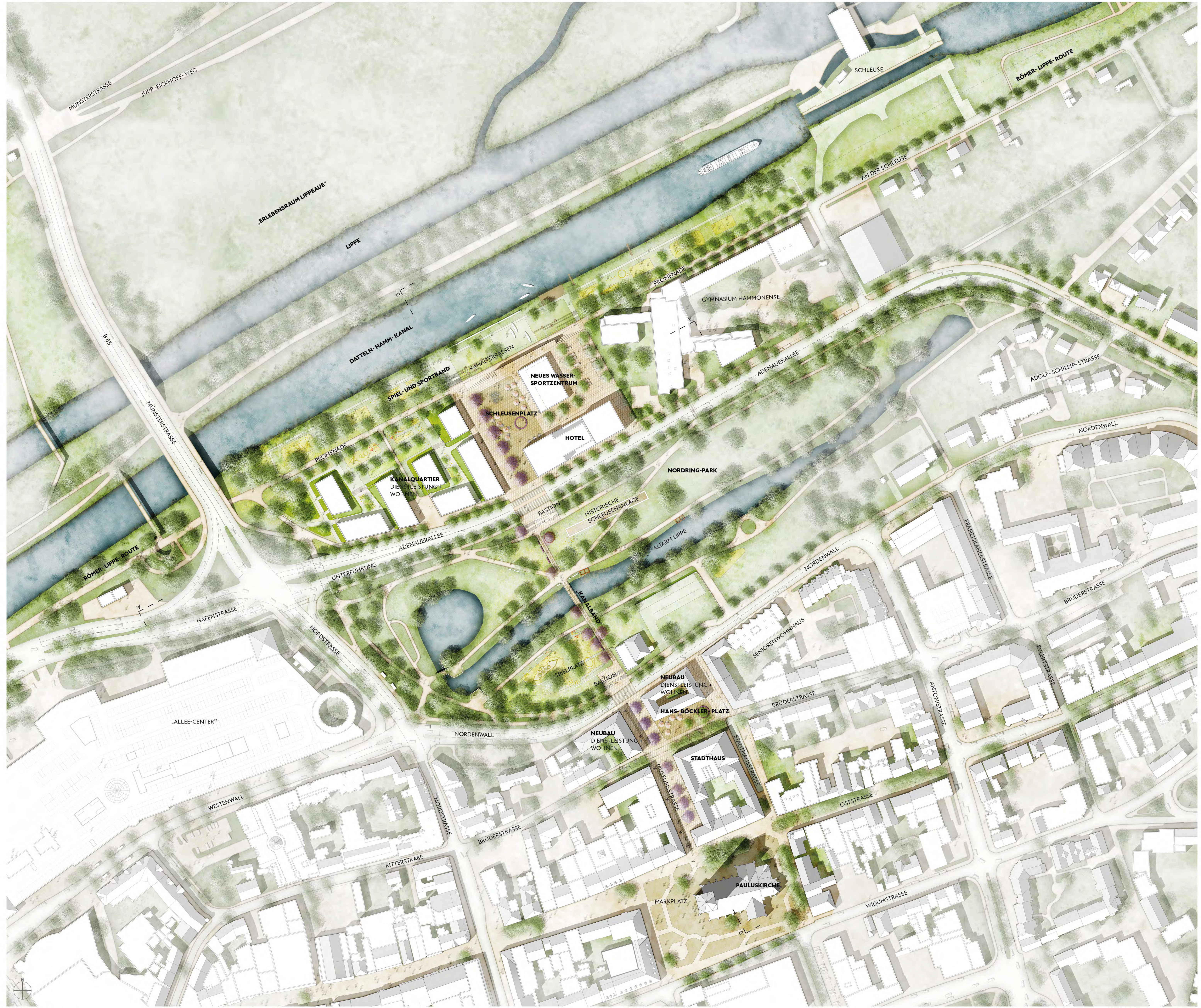
LAGEPLAN | M 1:1.000