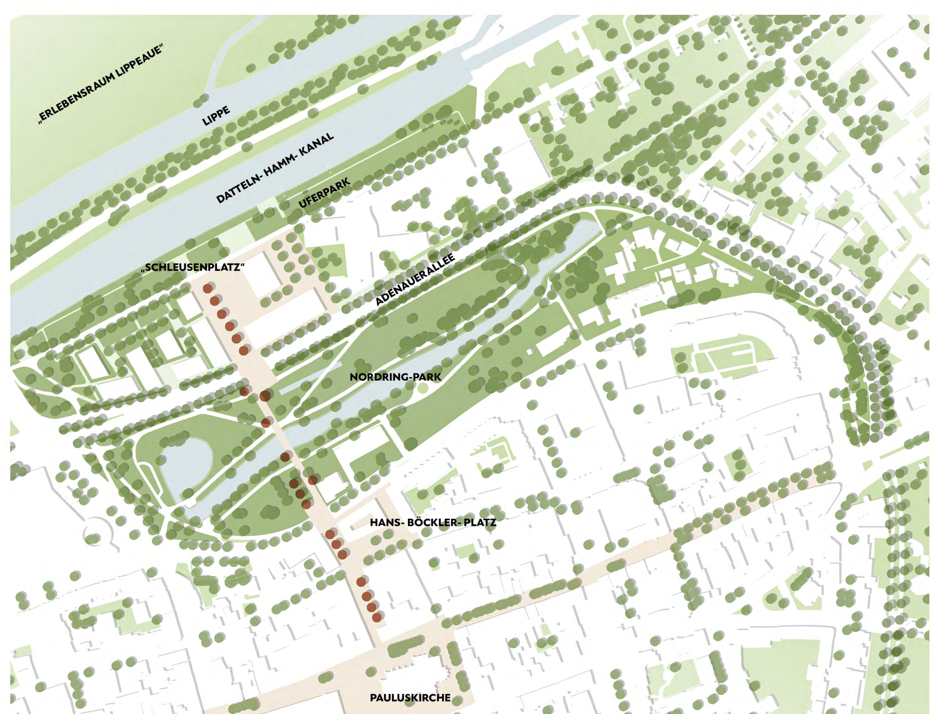
GRÜNPLAN | M 1:2.000