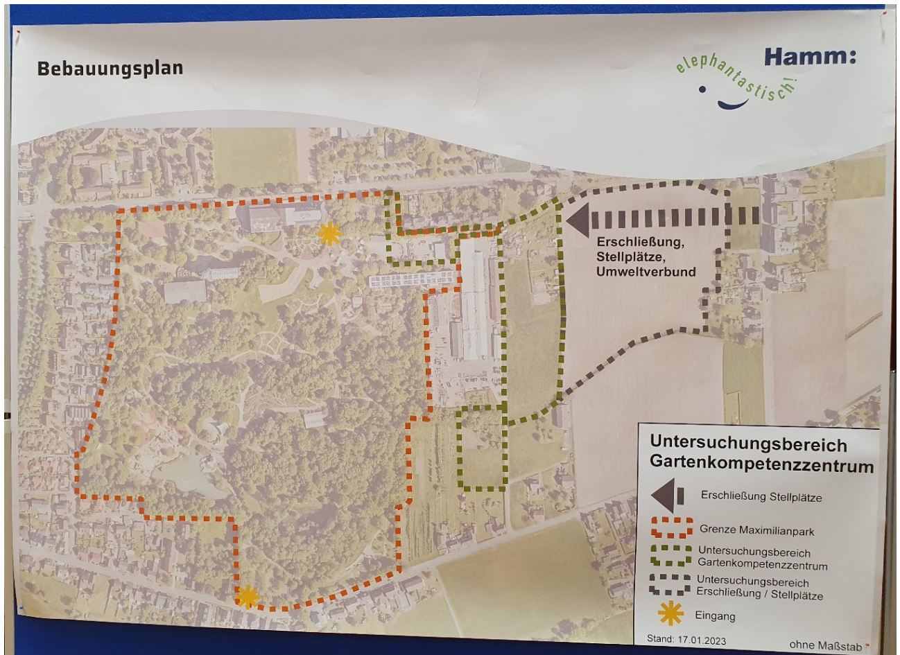
Abbildung 1 - Thementisch "Bebauungsplan"

Die Planungsrechtliche Grundlage für die Entwicklung östlich des Maxiparks soll der Bebauungsplan Nr. 02.129 – östlich Maximilianpark – schaffen. Das Verfahren hierzu ist mit dem Aufstellungsbeschluss im März 2023 gestartet. Als erster Schritt erfolgte am 15. August 2023 die formale frühzeitige Öffentlichkeitsbeteiligung gem. § 3 Abs. 1 Baugesetzbuch (BauGB).