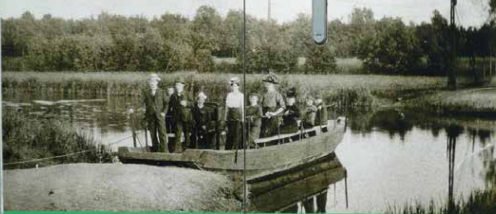
Lippefähre in Hamm, Anfang des 20. Jahrhunderts