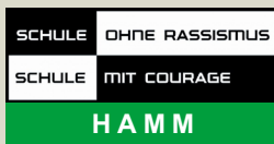
Schule ohne Rassismus – Schule mit Courage